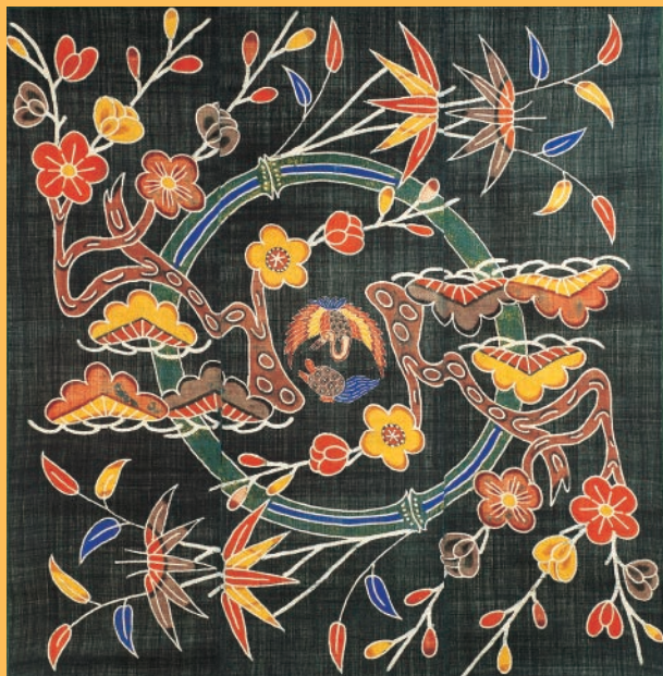
紅型風呂敷 鶴亀松竹梅文 国際基督教大学博物館湯浅八郎記念館所蔵 Bingata ceremonial wrapping cloth: design of crane, tortoise and shōchikubai from Collection of ICU Hachiro Yuasa Memorial Museum.

A tradition of sacred singing has been passed on in the Ryukyu islands for over 400 years. In this event we will listen to songs of creation myths from the court omoro tradition and secret songs from the regional umui genre. We will also hear performances of Christian hymns based on Ryukyuan folk songs and sung in the Ryukyuan language since the 19th century.