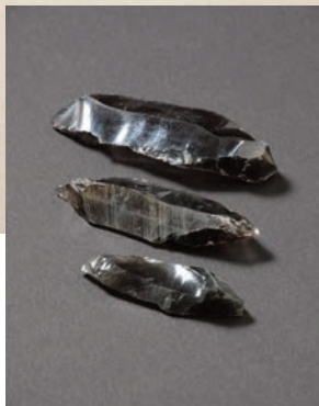
天文台構内遺跡V層下部出土 ナイフ形石器