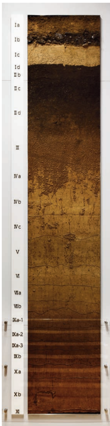
国際基督教大学構内遺跡第12地点 地層剥き取り標本

本展示では、日本有数の旧石器時代遺跡の密度の高さで知られる野川流域の暮らしを取り上げます。特にICU キャンパスのある野川中流域は、X層という日本列島最古級の時代から、III層という旧石器時代終末期までのほぼすべての層より、資料が豊富に出土する地域として知られています。今回、この地域の資料を集成し、層位と地点により大きく異なる石器の違いが何を意味するのか、また間氷期と氷期の環境変動のはざまに生きた人類の具体的な生活の営みについて、一般向けに分かりやすく解説します。なお、本展覧会および講演会は国際基督教大学と三鷹市の包括連携協定に基づく「三鷹まるごと博物館」の取り組みです。