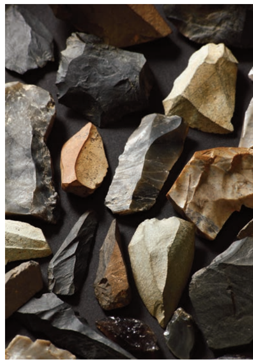
国際基督教大学構内遺跡第15地点出土石器

第122回湯浅八郎記念館公開講座・三鷹市考古学講演会 「野川中流域の旧石器時代 人と文化」