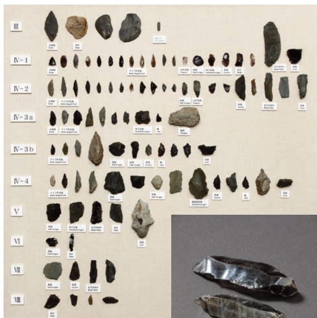
野川遺跡出土石器